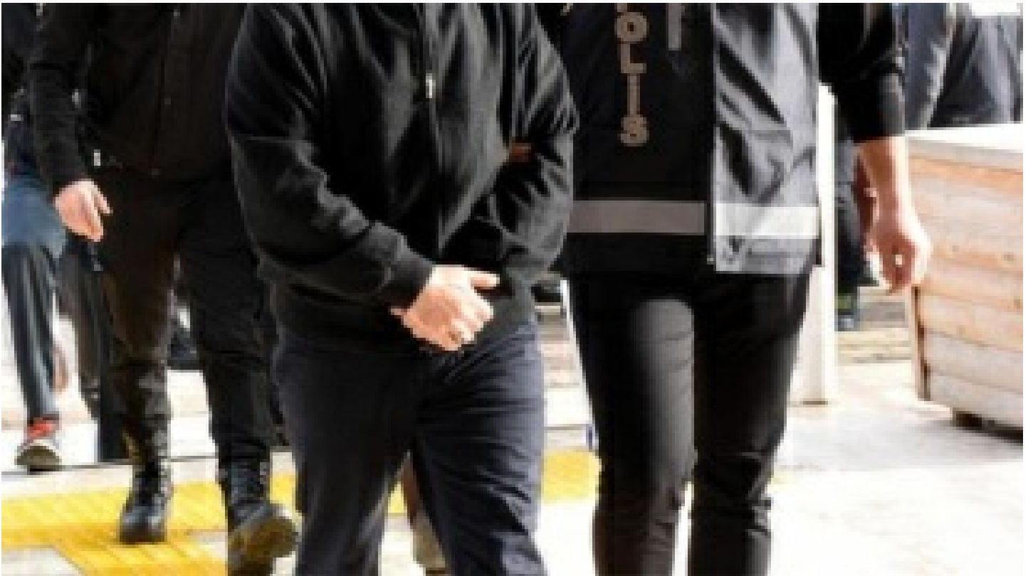
Balıkesir merkezli 4 ilde FETÖ operasyonu: 26 gözaltı