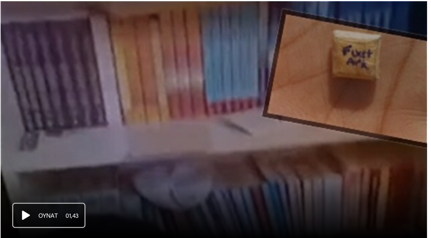
Canlı bomba notları vutmava çalıştı

“Bahoz” kod adını kullandığı belirtilen teröristin PKK/KCK terör örgütü adına faaliyet yürüttüğü, PKK/KCK terör örgütü içerisinde sorumlu düzeyde olduğu, PKK/KCK terör örgütünün sözde güvenlik tedbirleri prensiplerine bağlı kalarak cep telefonu kullanmadığı bunun yerine terör örgütü adına faaliyet yürüten kuryeler kullanarak terör örgütü yöneticileri irtibatlaştığı, PKK/KCK terör örgütü adına gerçekleştirilecek faaliyetlerini, eylem talimatlarını ve gerçekleşmiş faaliyet raporlarını kurye vasıtasıyla ilettiği, PKK/KCK terör örgütü adına eleman temin ederek terör örgütünün kırsal alanına gönderdiği, PKK/KCK terör örgütü adına canlı bomba eylemi yapabilecek örgütsel kapasitede olduğu belirlendi.