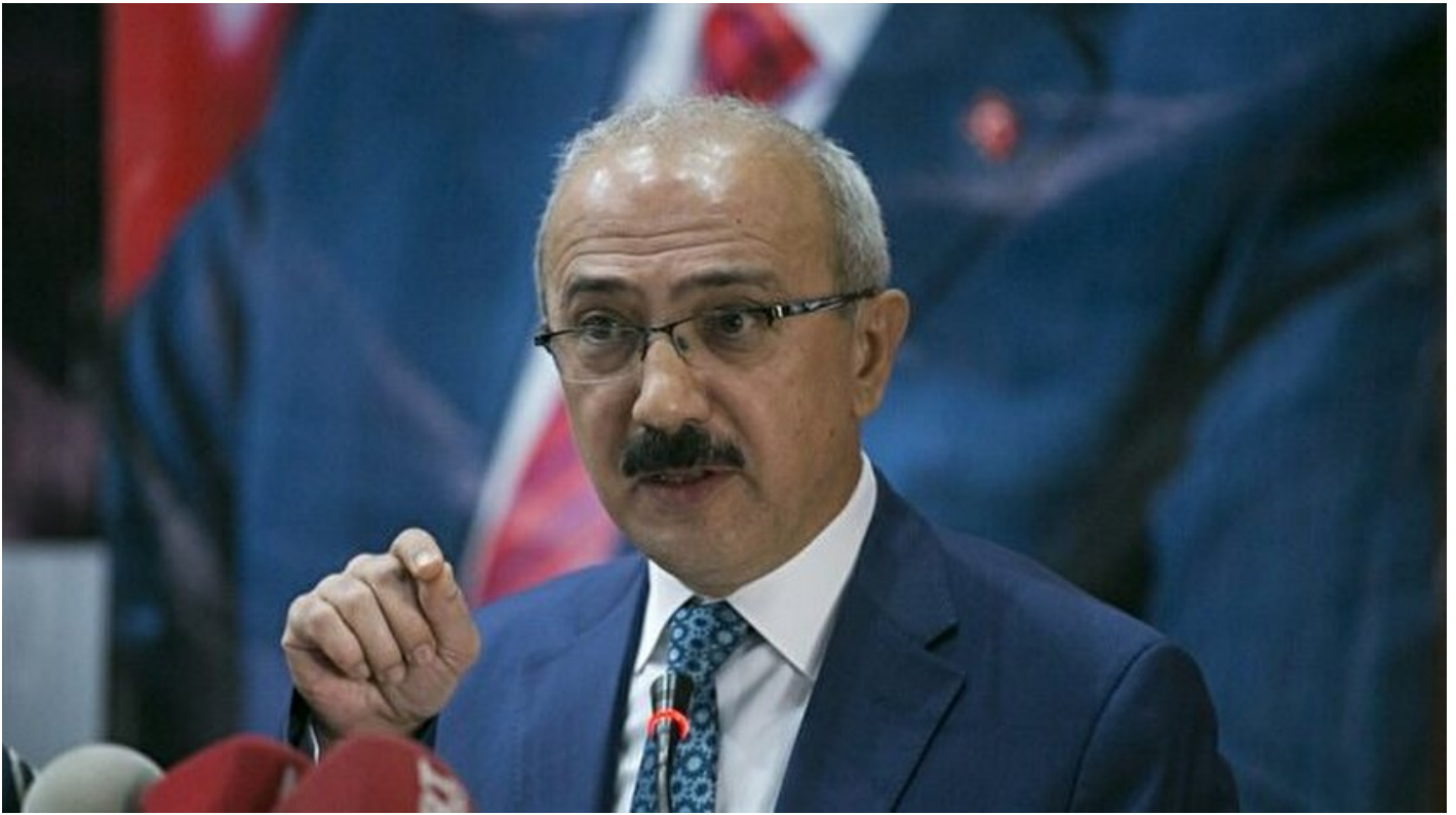
Kalkınma Bakanı Lütfi Elvan

Haber Merkezi · 20 Kasım 2016, 17:16 · Son Güncelleme: 20 Kasım 2016, 17:28 · AA