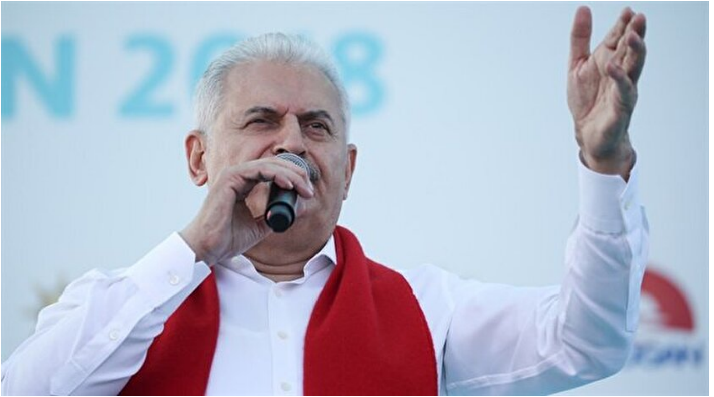
Başbakan Binali Yıldırım

Haber Merkezi · 03 Haziran 2018, 14:04 · Son Güncelleme: 03 Haziran 2018, 15:23 · AA