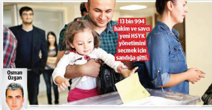
13 bin 994 hakim ve savcı yeni HSYK yönetimini seçmek için sandığa gitti.