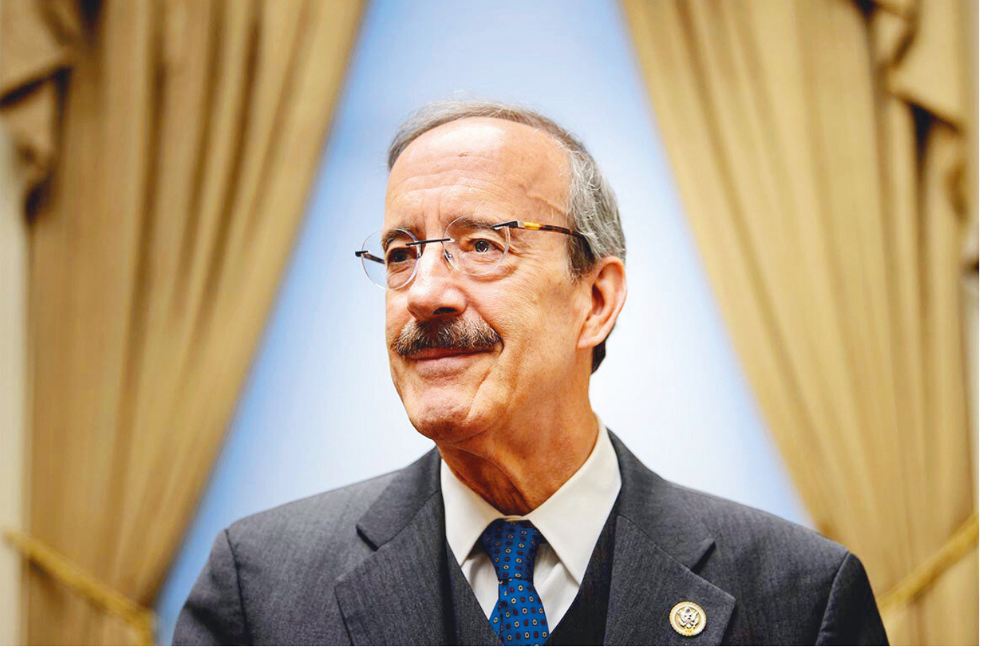
Dış İlişkiler Komitesi Başkanı Eliot Engel

Türk Silahlı Kuvvetleri'nin hiç vakit kaybetmeyip, PKK ve FETÖ terör örgütlerinin baş destekçisi Amerika'dan tüm personelini geri çağırması bekleniyor. ABD'ye karşı atılacak adımlar çerçevesinde Pentagon'un kullandığı İncirlik Üssü personeli hakkında muhtemel bir 'sınırdışı' adımının gelip gelmeyeceği ise merak konusu.