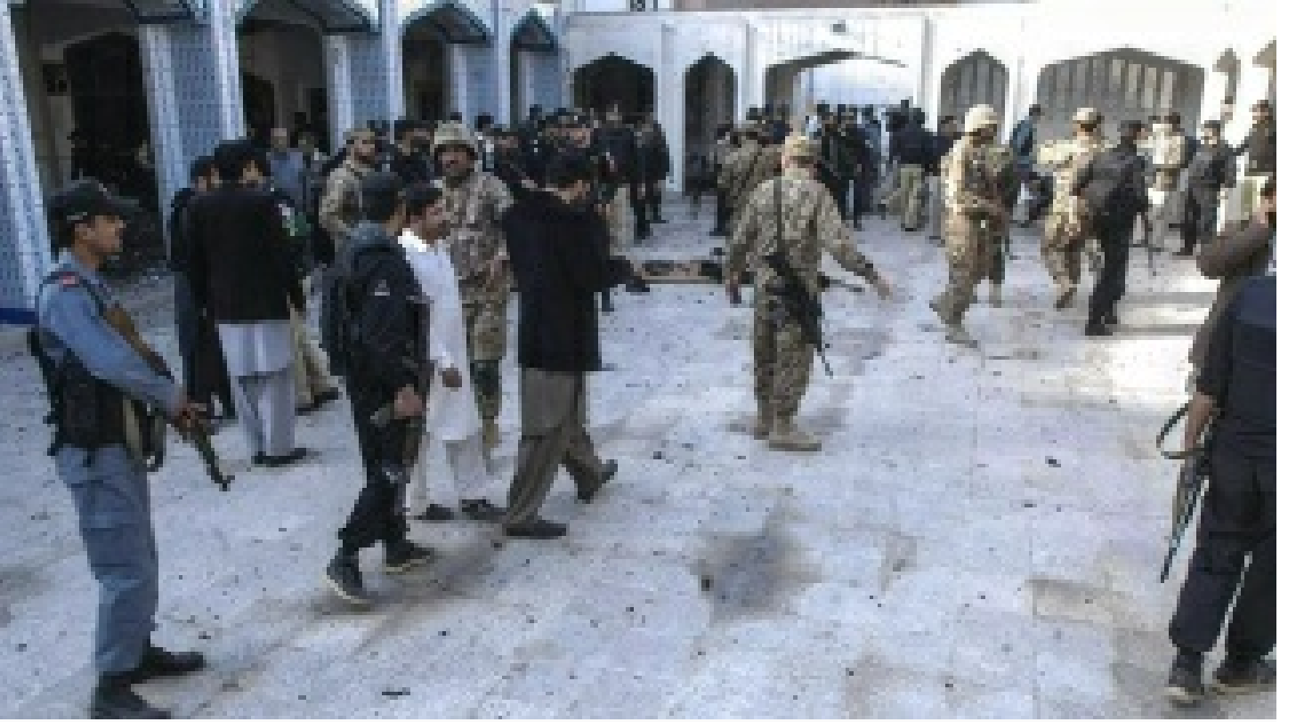
Pakistan'da camiye bombalı terör saldırısı