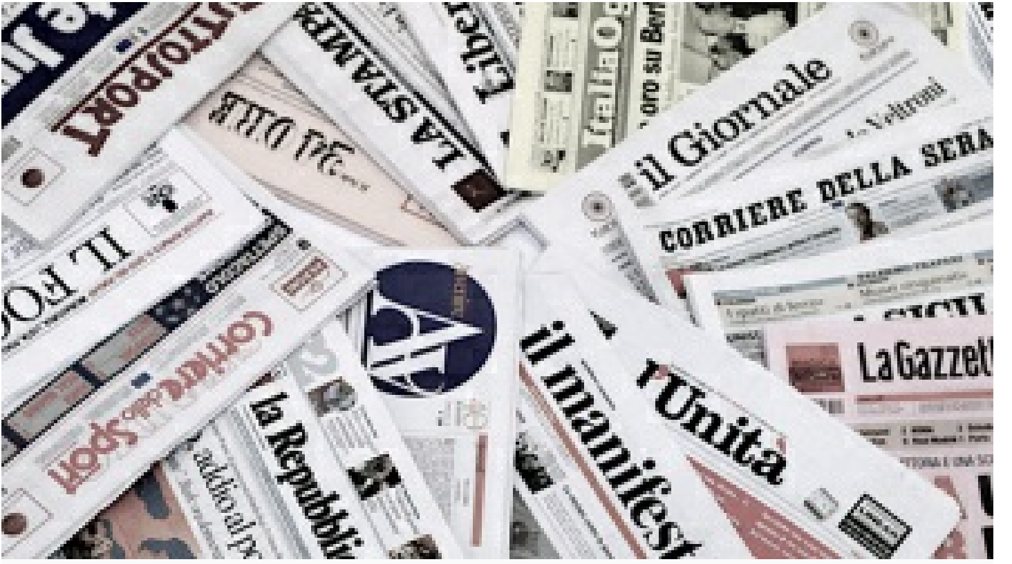
Rusya'dan Batı'nın medya ambargosuna cevap