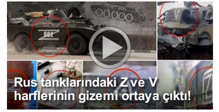
Rus tanklarındaki Z ve V harflerinin gizemi ortaya çıktı!