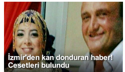
İzmir’den kan donduran haber! Cesetleri bulundu