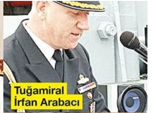
Tuğamiral İrfan Arabacı