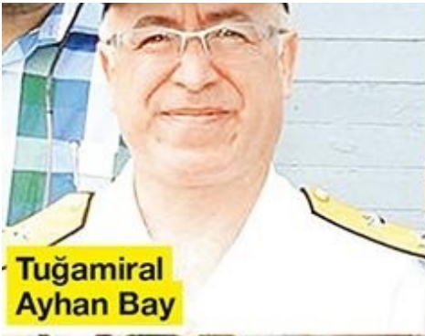
Tuğamiral Ayhan Bay