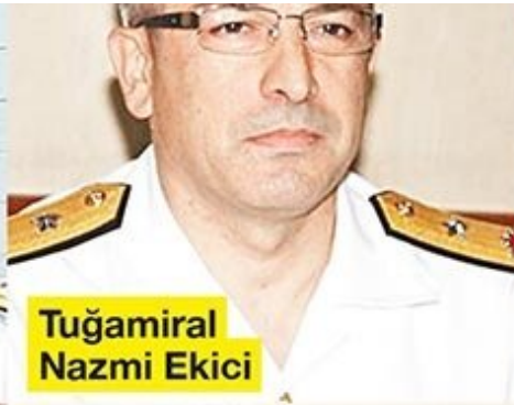
Tuğamiral Nazmi Ekici