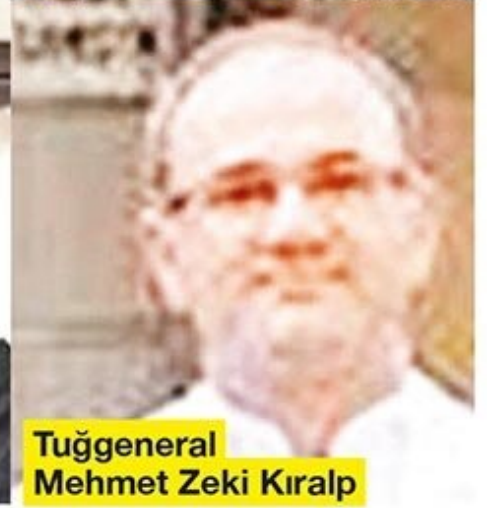
Tuğgeneral Mehmet Zeki Kıralp

9'u general olmak üzere 288 asker firari durumda.