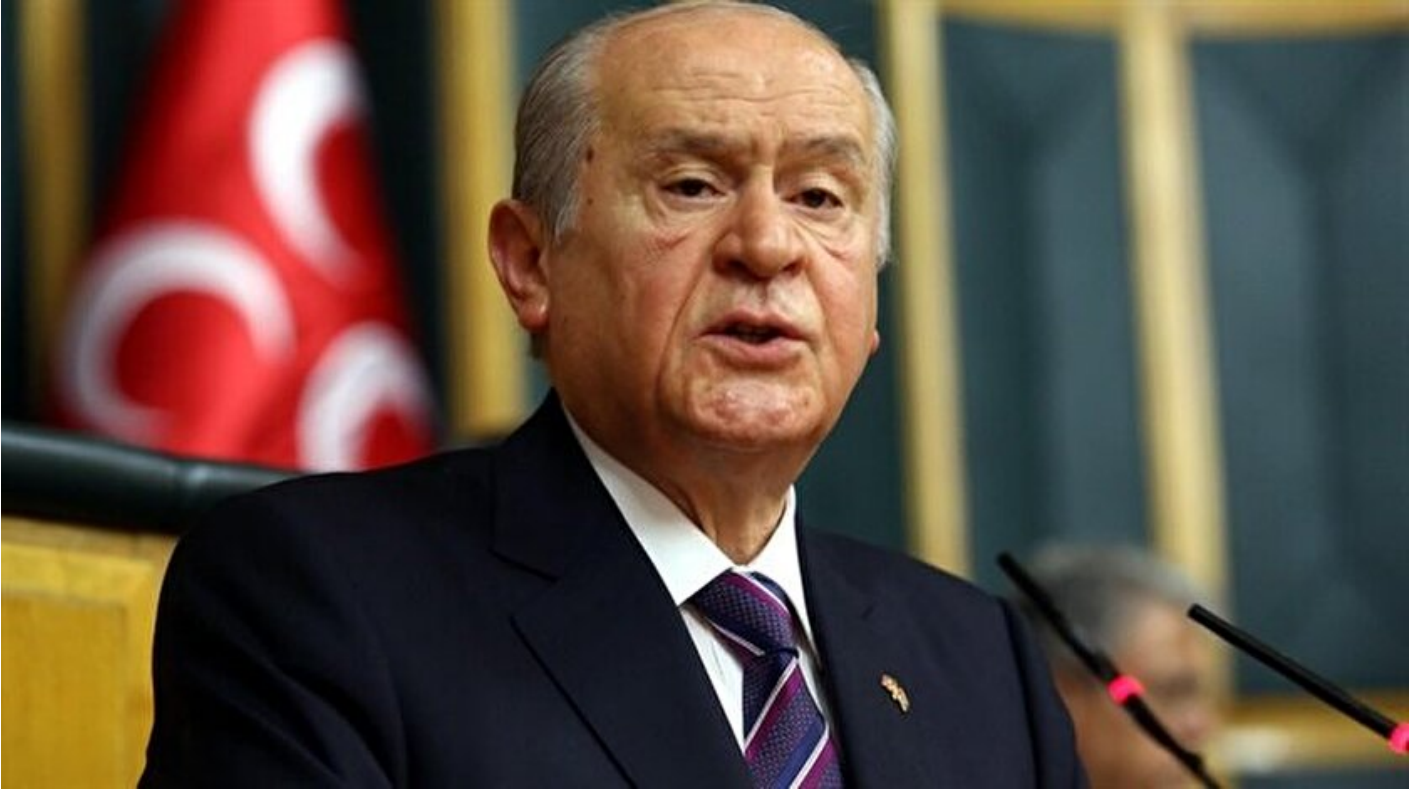
MHP lideri Bahçeli

Haber Merkezi · 19 Nisan 2017, 04:00 · Yeni Şafak