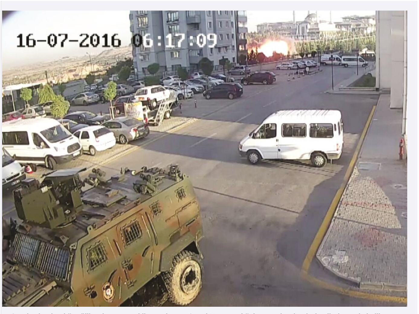
Cumhurbaşkanlığı Külliyesi ve çevresi ile Jandarma Genel Komutanlığı korumasında, darbecilerin uşuk helikopter