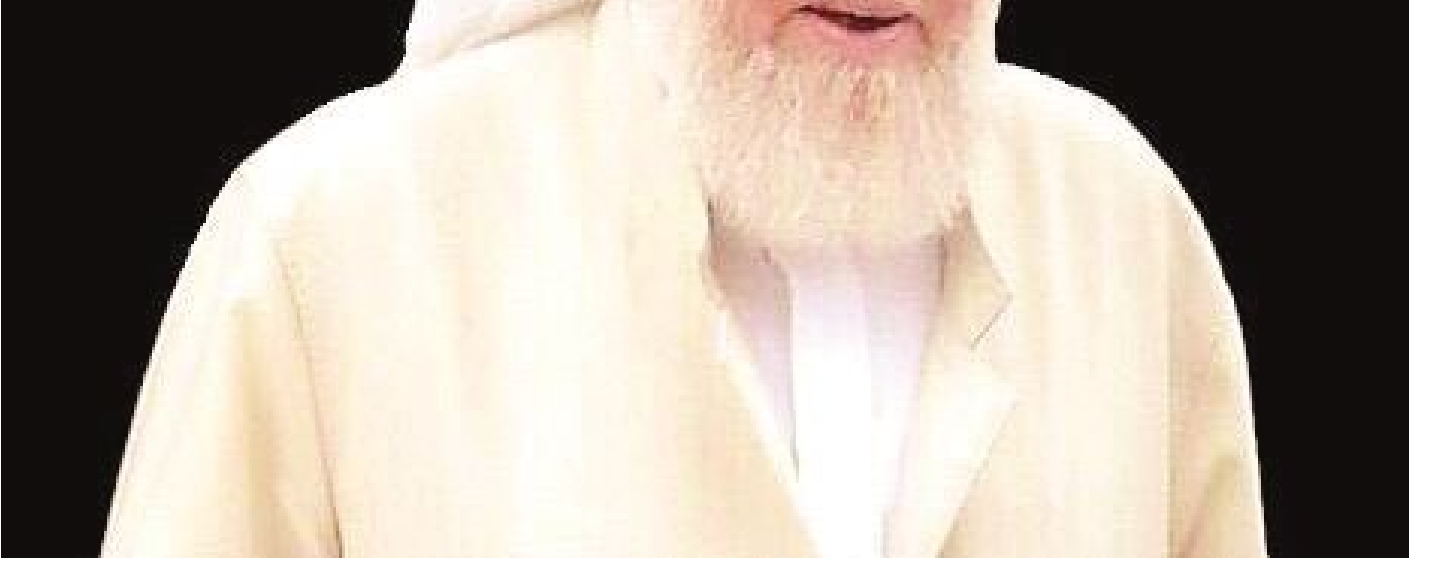
Şeyh Bedrettin Aydın