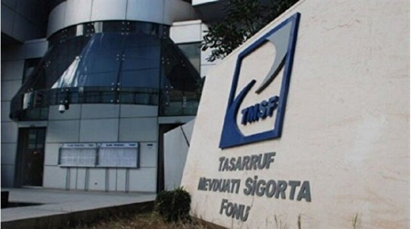
Tasarruf Mevduatı Sigorta Fonu (TMSF)

Haber Merkezi · 14 Aralık 2016, 14:39 · Son Güncelleme: 14 Aralık 2016, 14:58 · AA