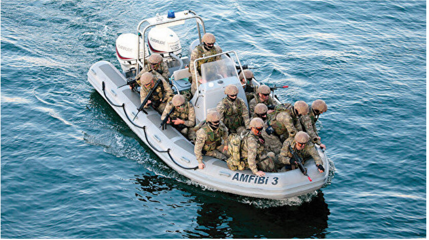
Mavi Vatan 2019 Tatbikatı