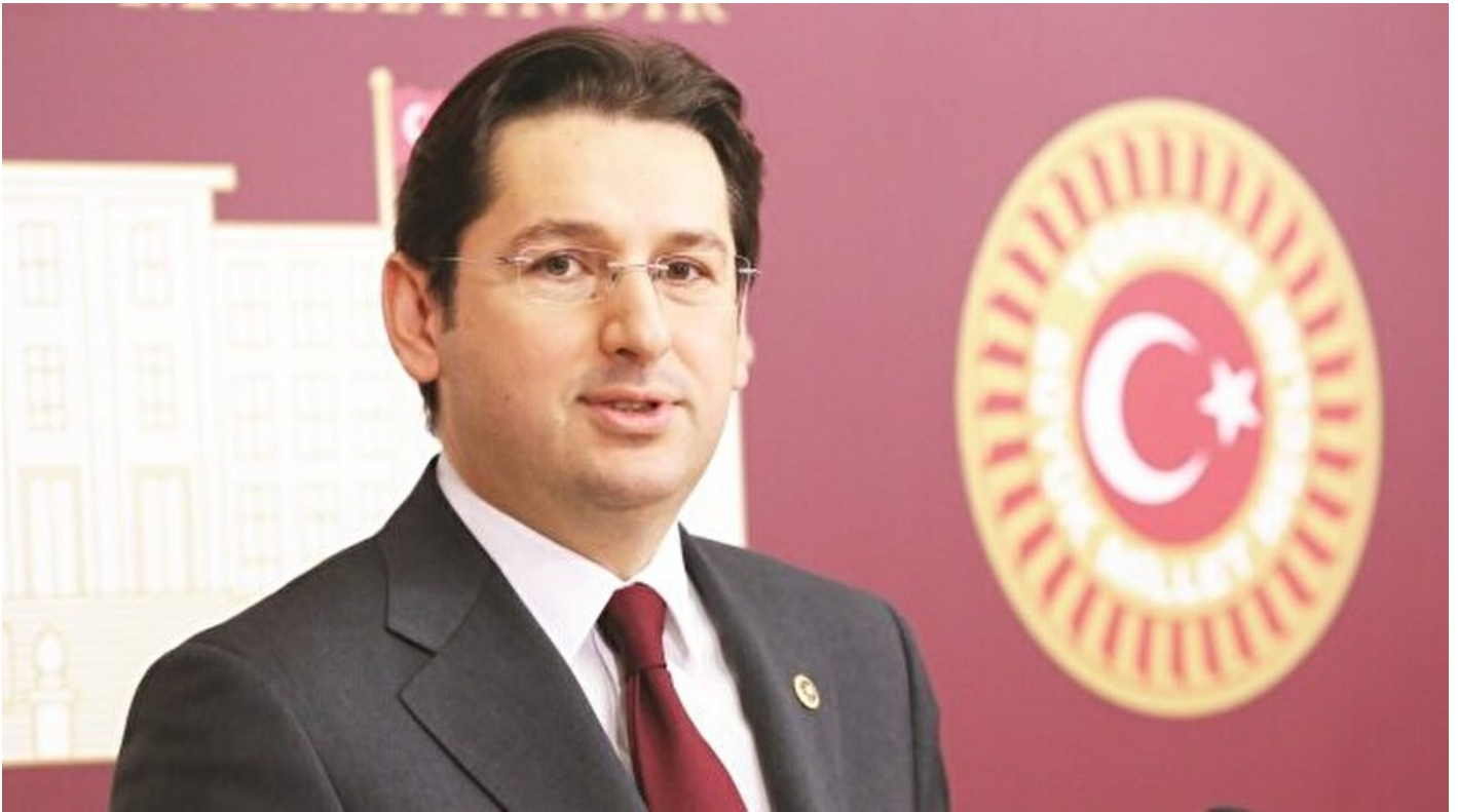
CHP Bursa Milletvekili Aykan Erdemir

Mustafa Sait Özkan · 07 Aralık 2017, 04:00 · Yeni Şafak