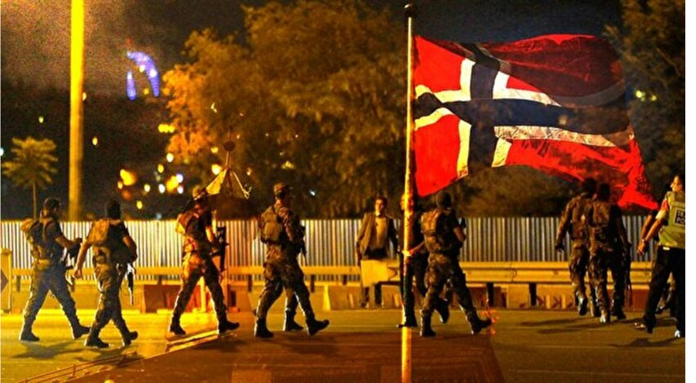
Darbecilere NATO koruması

Haber Merkezi · 23 Mart 2017, 04:00 · Son Güncelleme: 24 Mart 2017, 19:28 · Yeni Şafak