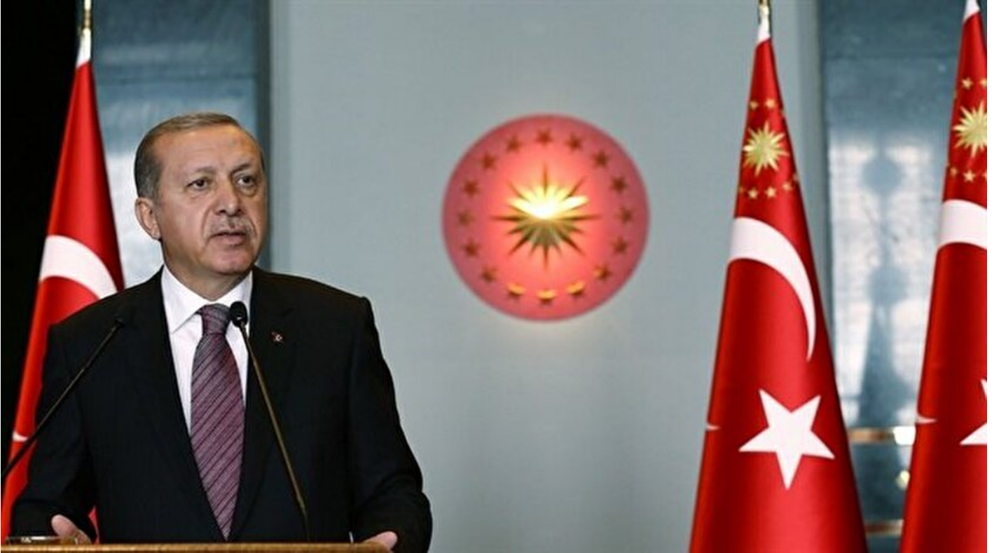
Cumhurbaşkanı Recep Tayyip Erdoğan