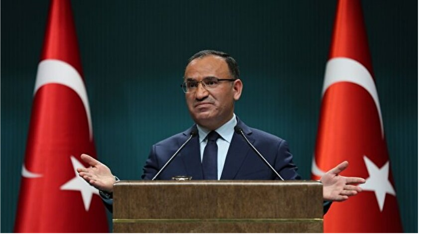
Hükümet Sözcüsü Bekir Bozdağ

Haber Merkezi · 28 Mayıs 2018, 10:47 · Son Güncelleme: 28 Mayıs 2018, 16:30 · Yeni Şafak