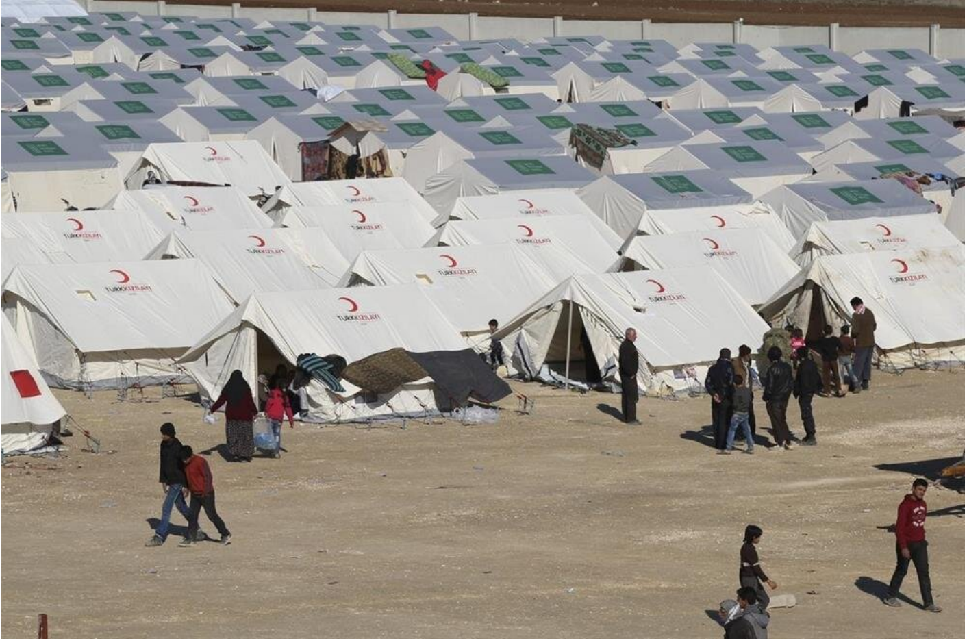
Suriyeli mülteci kampı