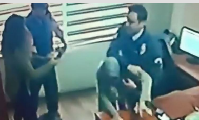
Yardım istedi, darbedilerek dışarıya atıldı