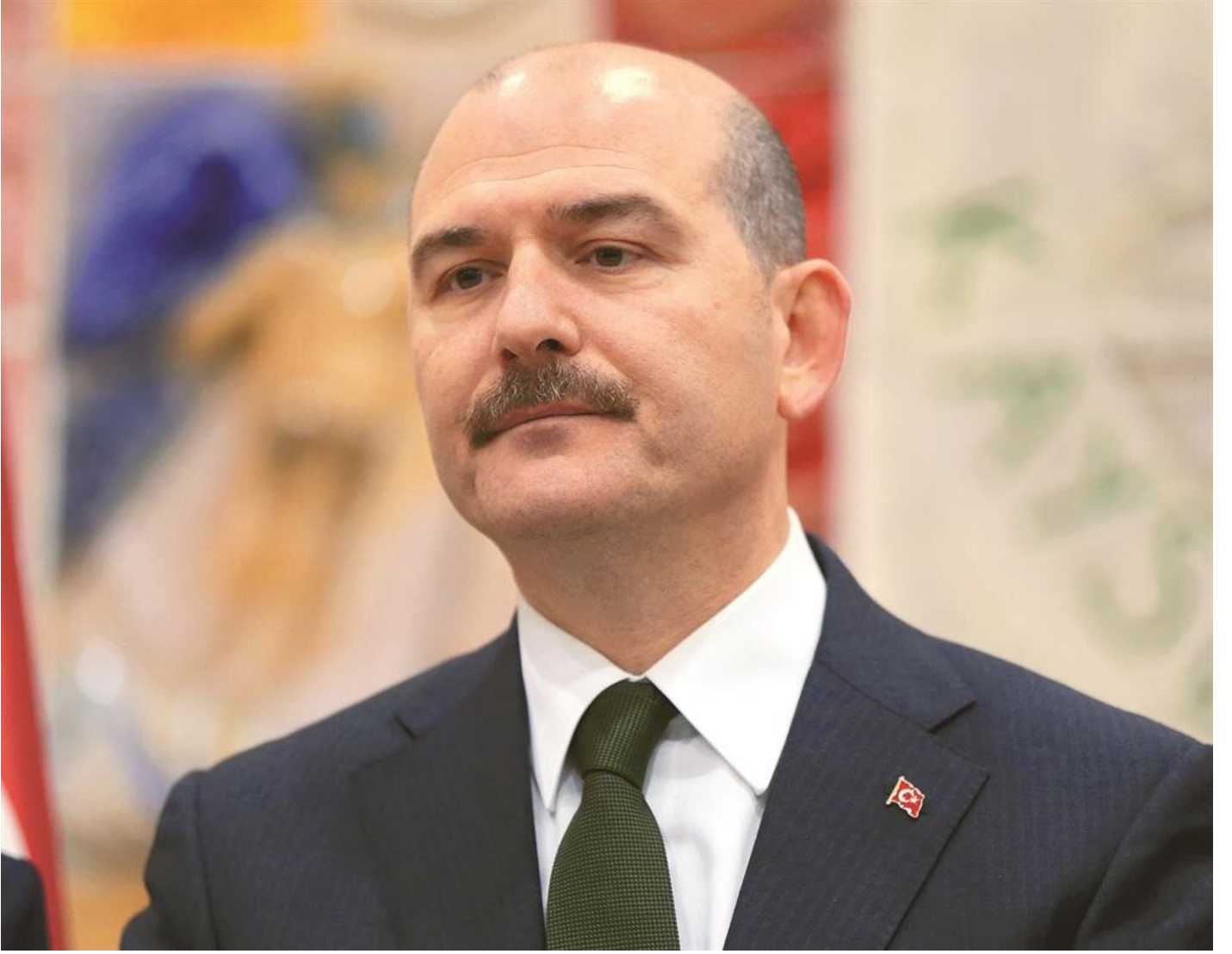
İçişleri Bakanı Süleyman Soylu