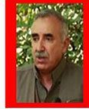
KARAYILAN MURAT ŞANLIURFA-1954 DOĞUMLU PKK/KCK Terör Örgütü