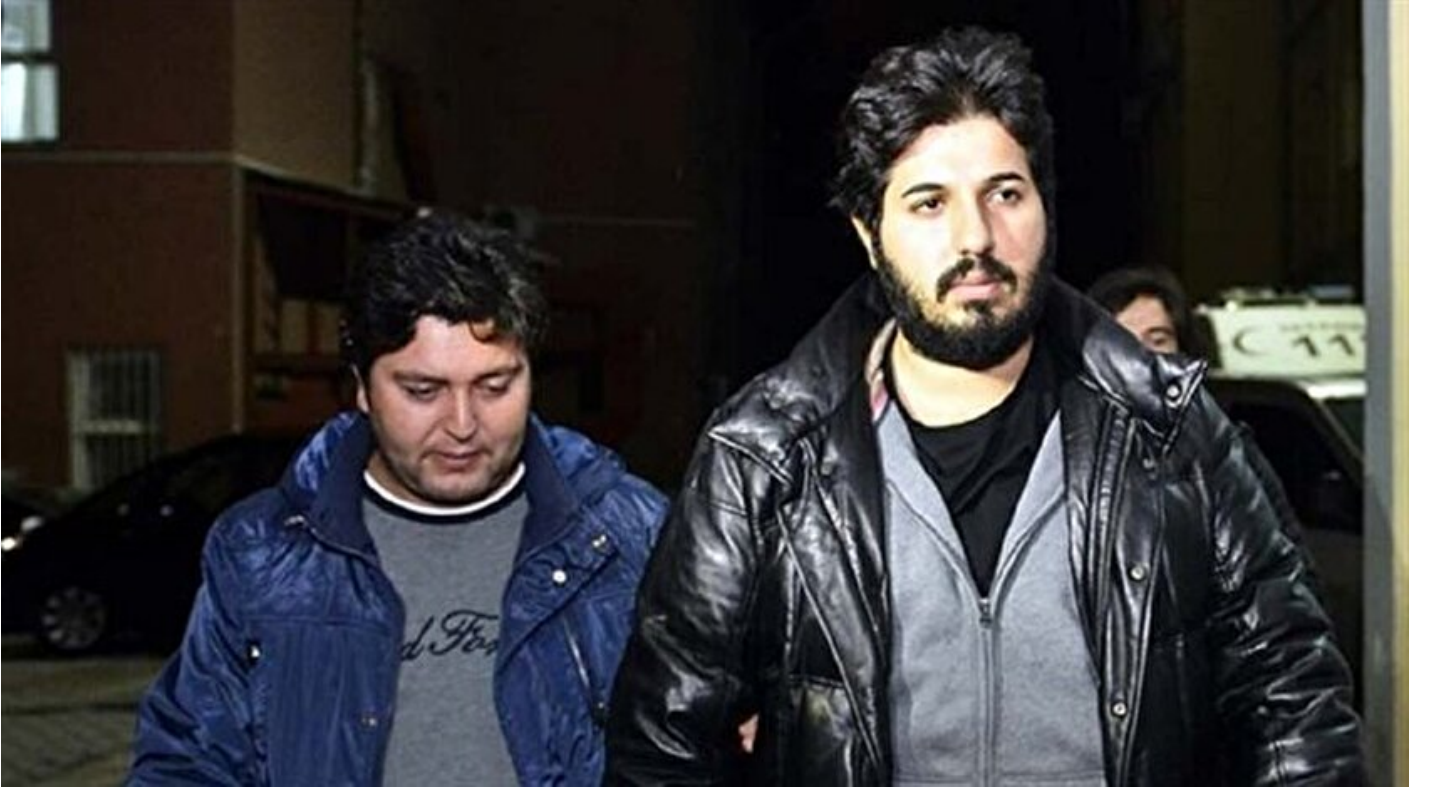
ABD'de tutuklu bulunan Reza Zarrab

Haber Merkezi · 28 Kasım 2017, 20:23 · Son Güncelleme: 28 Kasım 2017, 21:02 · Yeni Şafak