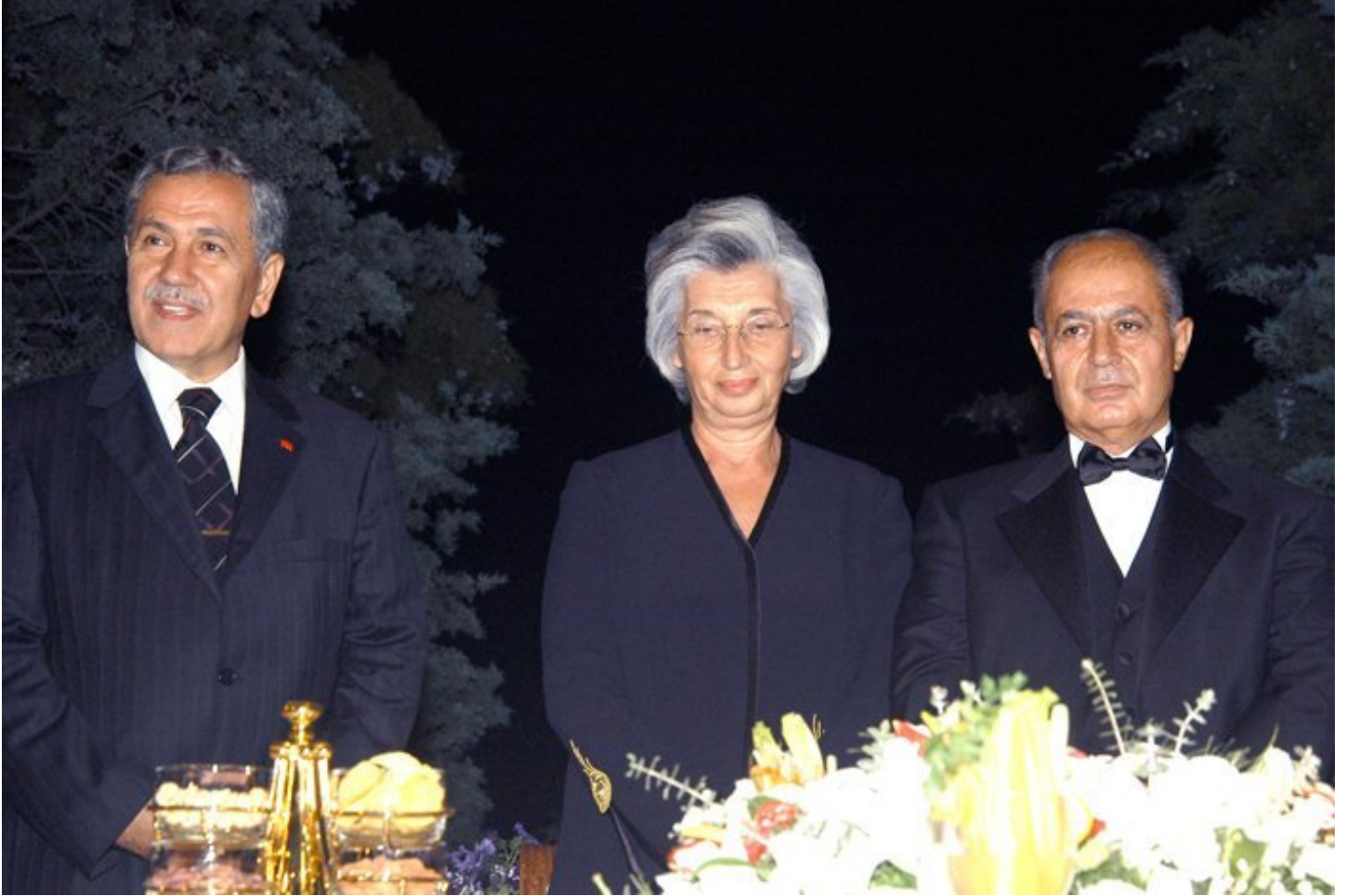
Bülent Arınç TBMM Başkanı sıfatı ile Cumhurbaşkanı Ahmet Necdet Sezer'in verdiği 30 Ağustos resepsiyonuna katılıyor. Arın. 2002-2007 yılları arasında TBMM Başkanlığı yapmıştı.

Başbakan Yardımcısı Bülent Arınç Türkiye'de internete getirilmesi planlanan yeni denetimler konusunda açıklamalarda bulunmuştu. Dönemin TÜSİAD Başkanı Ümit Boyner'in yeni internet yasasını eleştirmesi üzerine Arınç, "Sayın Boyner'in de çocukları var. Boyner ya da öyle düşünenler iktidara gelirse, porno sitelerini serbest bırakabilirler" diye konuşunca, Boyner de, bireysel özgürlükleri pornoyla bağdaştırmasının Arınç'ın 'sağlıksız düşünce yapısını' ortaya çıkardığını söylemişti. Boyner, "Beni ve çocuklarımı gündeme getirerek elde etmek istediği siyasi rantı ayıplıyorum" demişti.