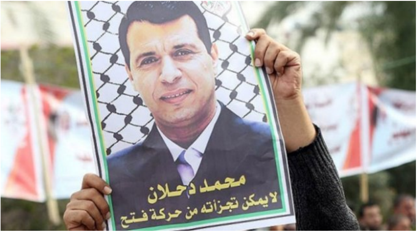
Muhammed Dahlan terörden arananlar listesinde kırmızı kategoride