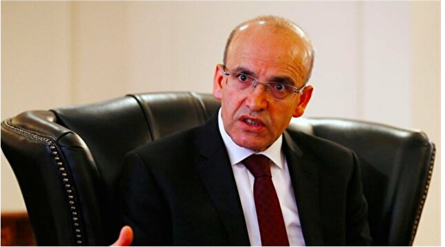
Ekonomiden sorumlu Başbakan Yardımcısı Mehmet Şimşek

Haber Merkezi · 07 Şubat 2018, 09:47 · Son Güncelleme: 07 Şubat 2018, 09:57 · AA