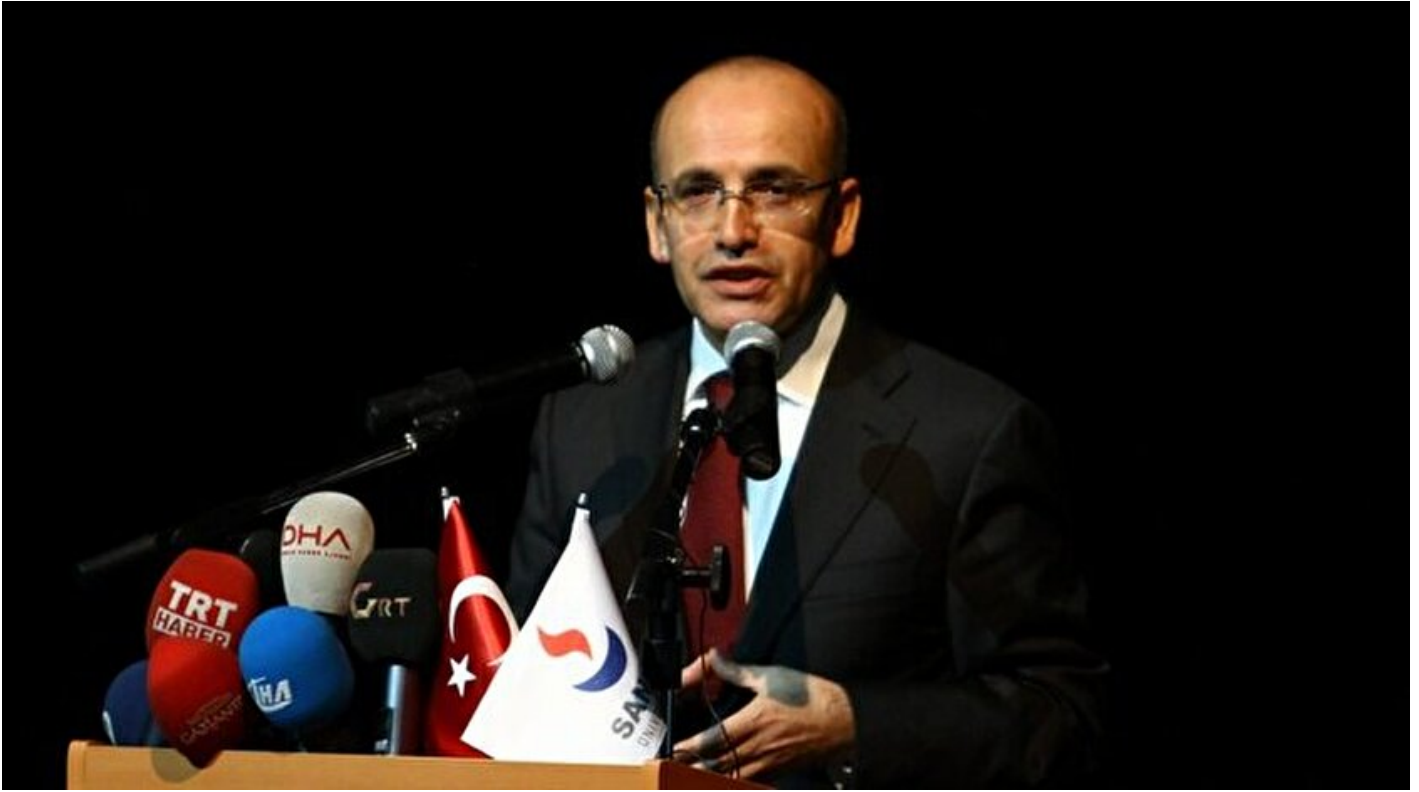
Başbakan Yardımcısı Mehmet Şimşek

Haber Merkezi · 22 Kasım 2016, 14:18 · Son Güncelleme: 22 Kasım 2016, 15:54 · AA