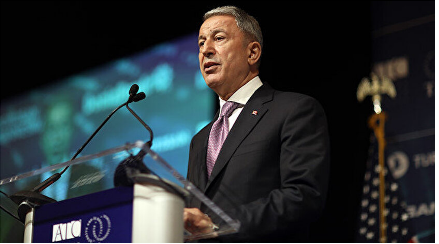
Milli Savunma Bakanı Hulusi Akar

Haber Merkezi · 15 Nisan 2019, 22:20 · Son Güncelleme: 15 Nisan 2019, 22:28 · AA