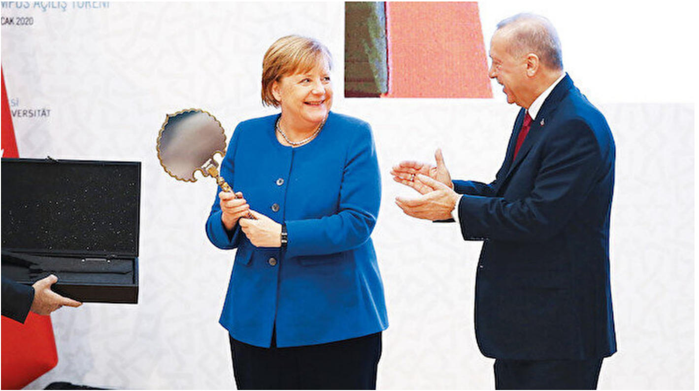
Recep Tayyip Erdoğan ve Angela Merkel