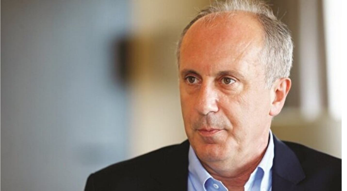
CHP'nin cumhurbaşkanı adayı Muharrem İnce

Haber Merkezi · 01 Haziran 2018, 04:00 · Yeni Şafak