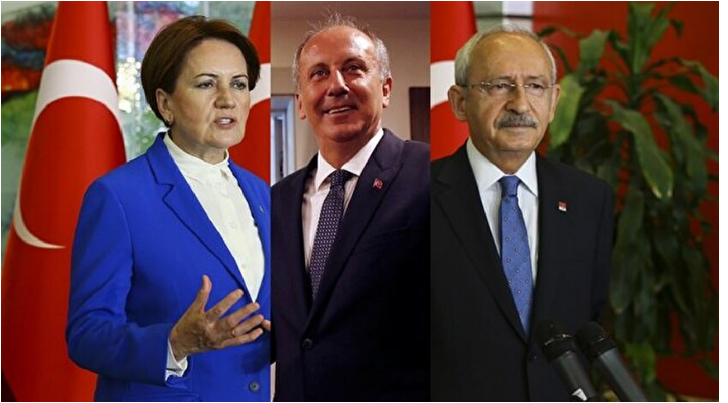
Meral Akşener- Muharrem İnce - Kemal Kılıçdaroğlu