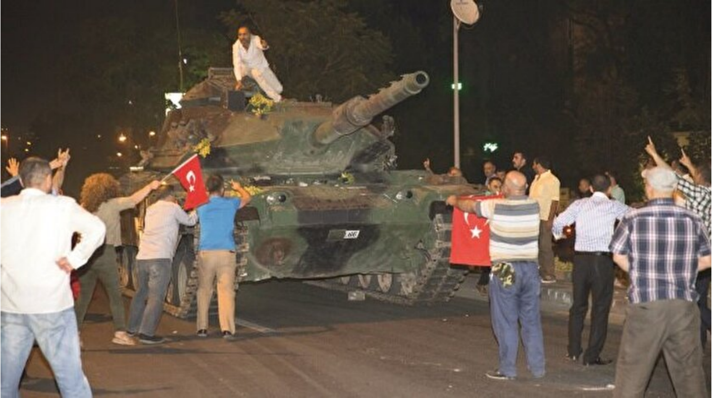
Milleti muzaffer eyleyen ilahi kudret idi

Haber Merkezi · 15 Temmuz 2017, 15:05 · Son Güncelleme: 15 Temmuz 2017, 17:48 · Yeni Şafak