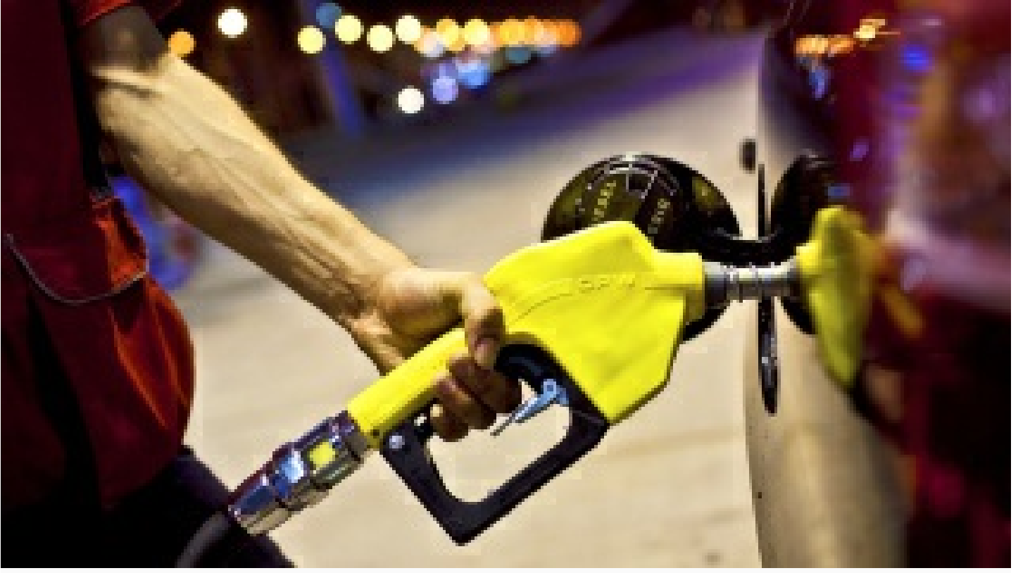
Benzin ve motorinde fiyat artışı