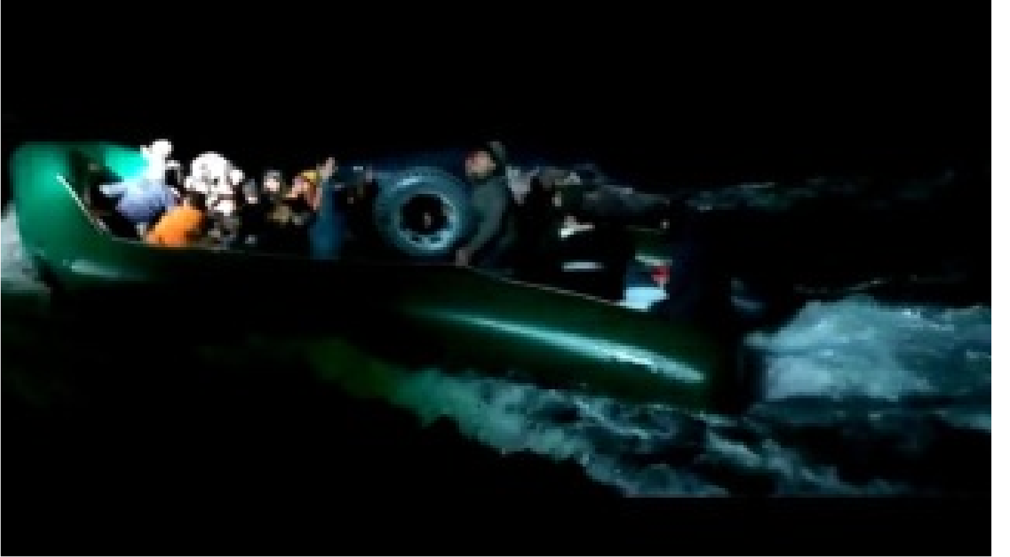
Muğla açıklarında 35 düzensiz göçmen yakalandı