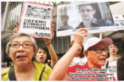
Hong Kong'daki ABD büyükelçiliği önünde toplanan halkı Snowden'e destek verdi.