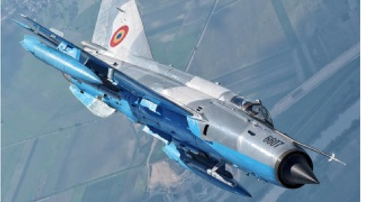
Önce uçak sonra helikopter ardından gemi