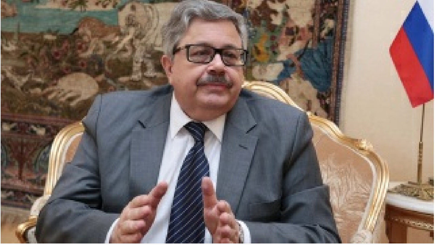
Rus Büyükelçi Yerhov: Yaptırımlar geri adım attırmayacak!