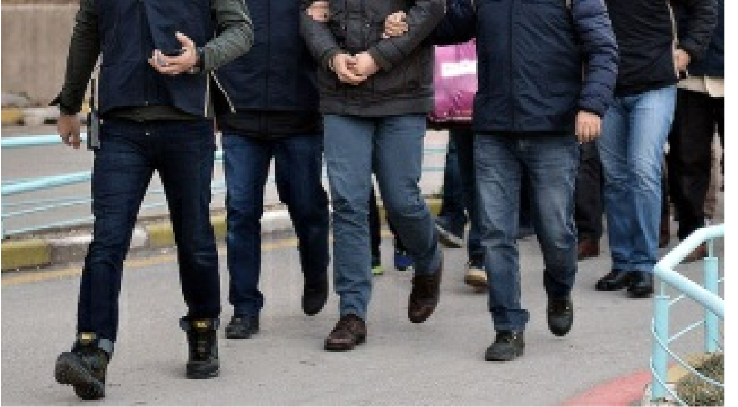
Ankara'da FETÖ operasyonu: 10 gözaltı