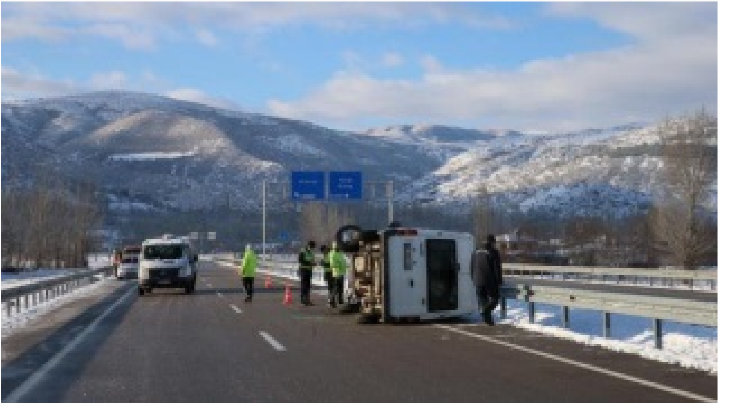
Askerleri taşıyan servis devrildi: 1 şehit, 3 yaralı