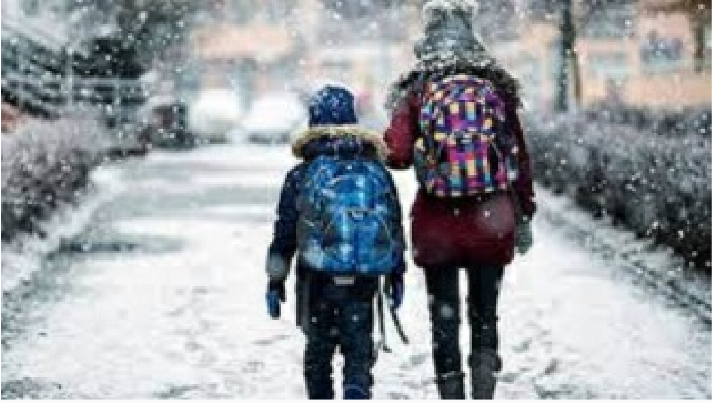
8 ilde eğitime kar engeli