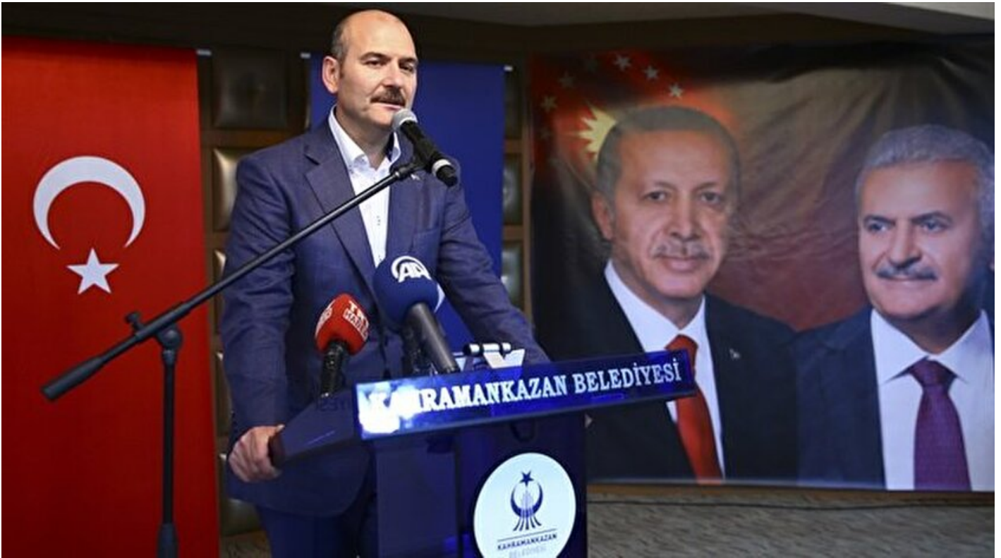
İçişleri Bakanı Süleyman Soylu