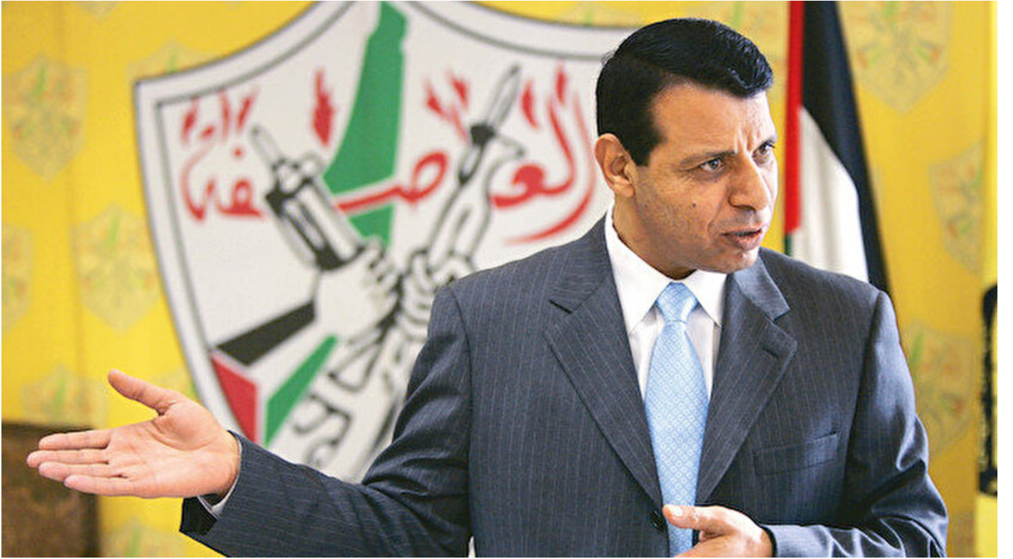
Kiralık katil Muhammed Dahlan