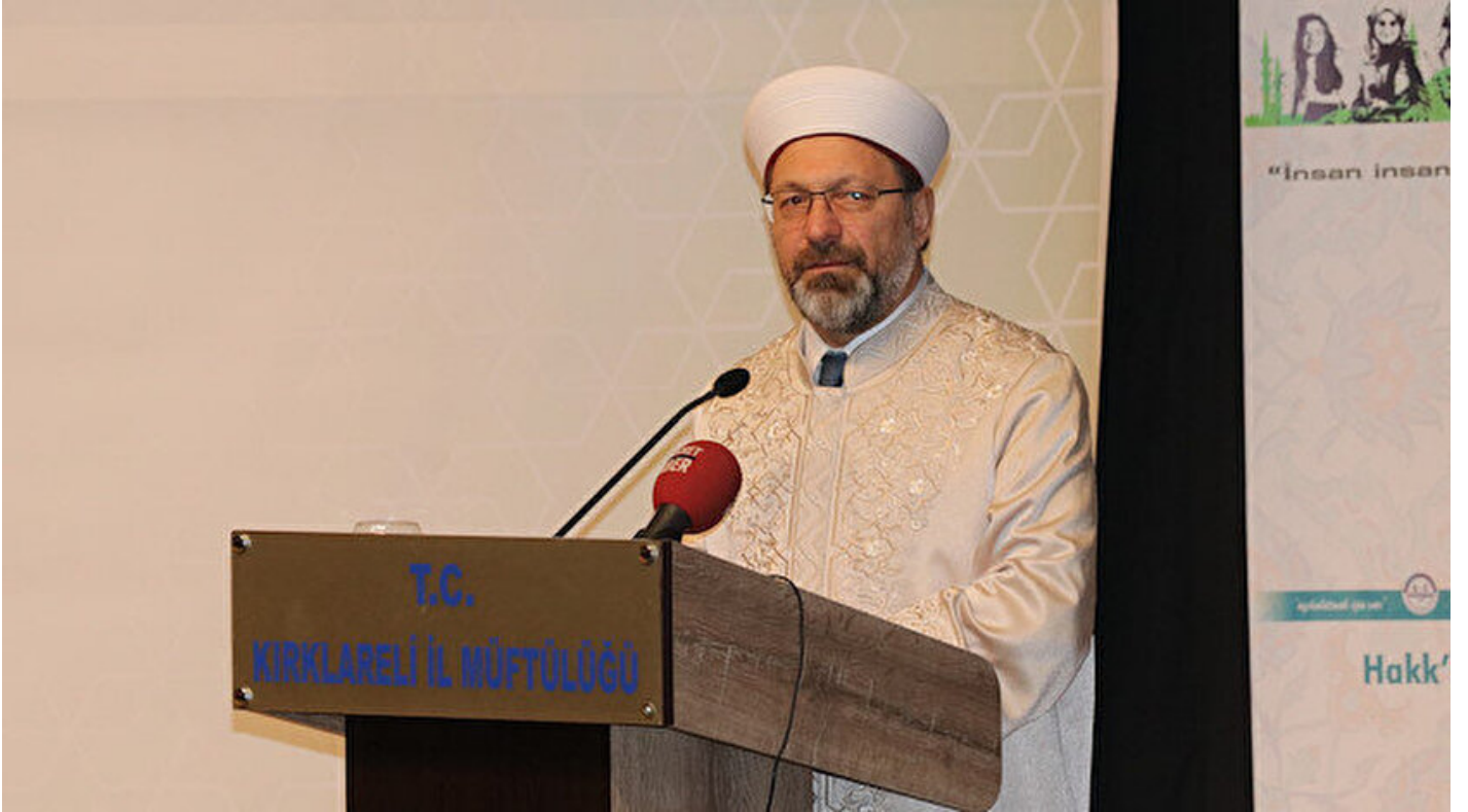
Diyaret İşleri Başkanı Ali Erbaş

Haber Merkezi • 03 Nisan 2019, 22:59 • Son Güncelleme: 03 Nisan 2019, 23:04 • AA