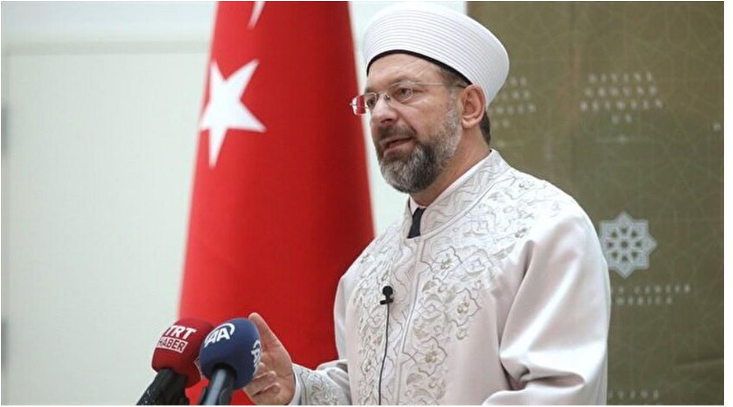
Diyanet İşleri Başkanı Erbaş