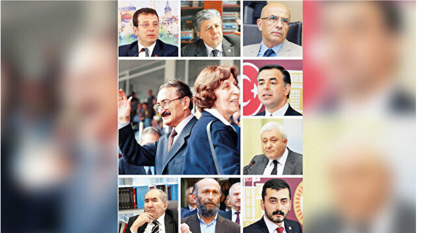
Medyayı dizayn etmeye çalışan CHP'li isimler

Haber Merkezi • 15 Şubat 2020, 04:00 • Yeni Şafak