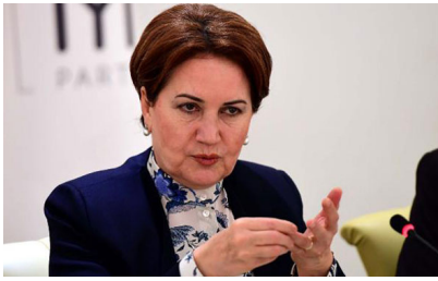
İYİ Parti'den bomba rapor! FETÖ eylem hazırlığında