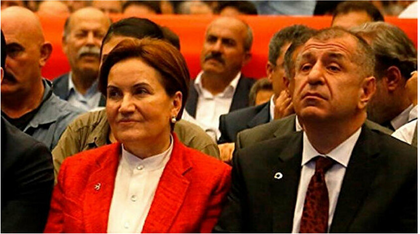
Meral Akşener ve Ümit Özdağ