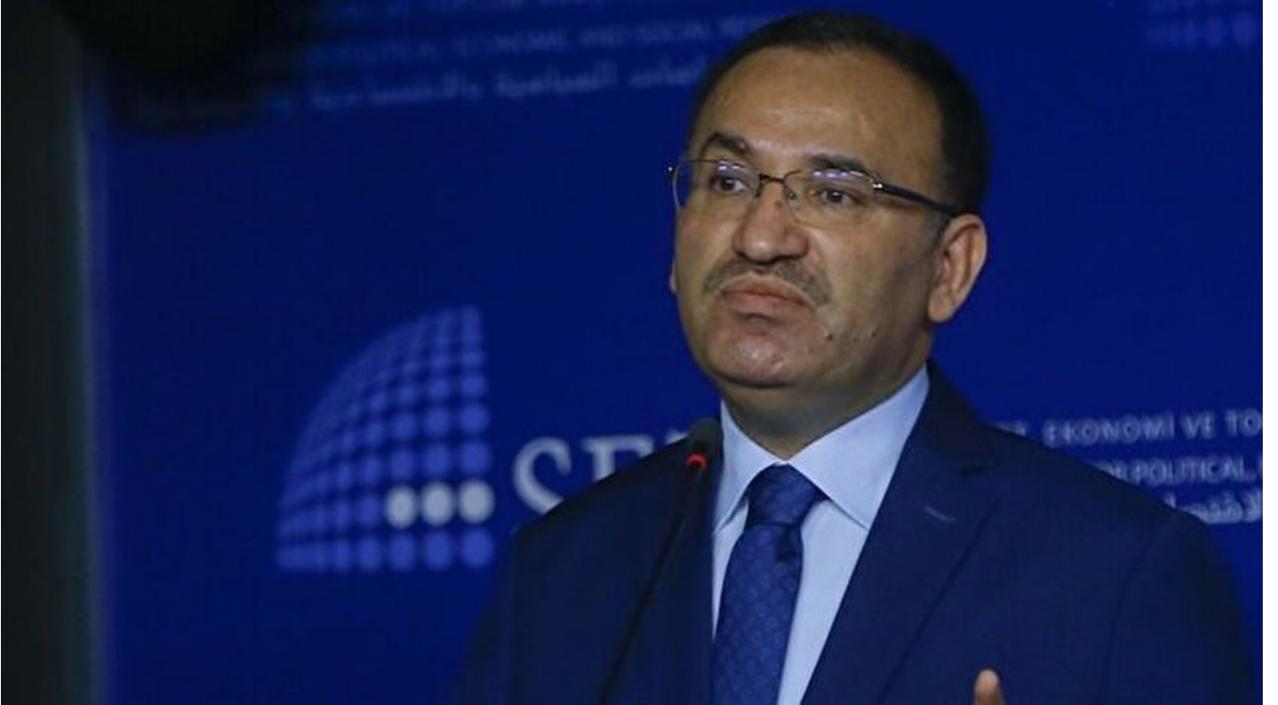
Adalet Bakanı Bekir Bozdağ

Haber Merkezi · 03 Mart 2017, 10:44 · Son Güncelleme: 03 Mart 2017, 10:59 · Yeni Şafak