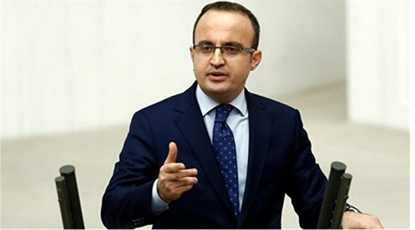
AK Parti Grup Başkanvekili Bülent Turan