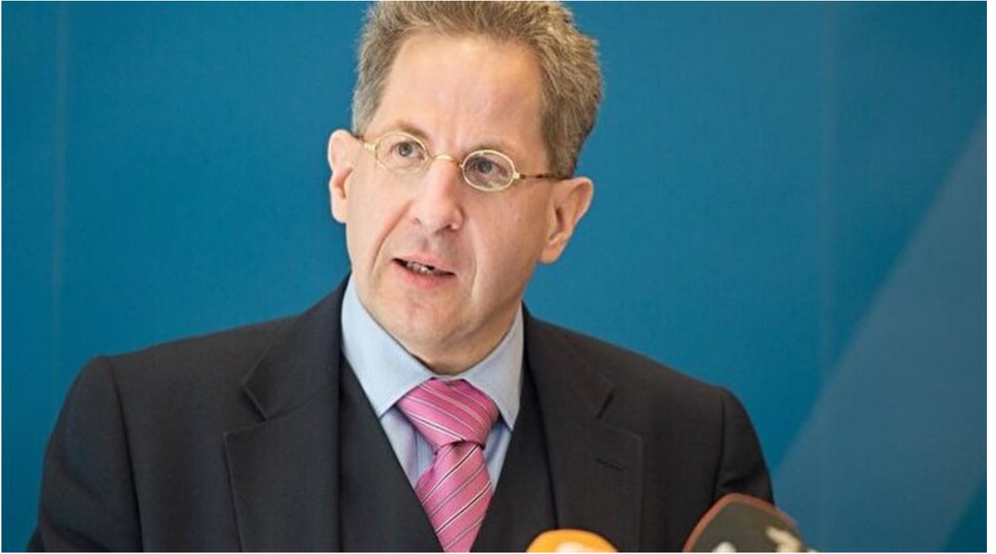
Alman iç istihbarat servisi Anayasayı Koruma Teşkilatı Başkanı Hans-Georg Maassen.