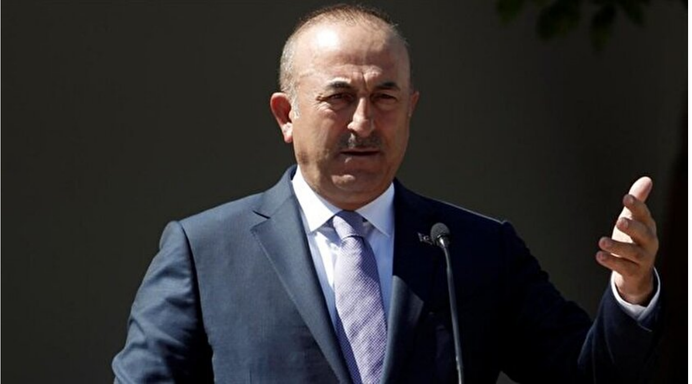
Dışişleri Bakanı Mevlüt Çavuşoğlu