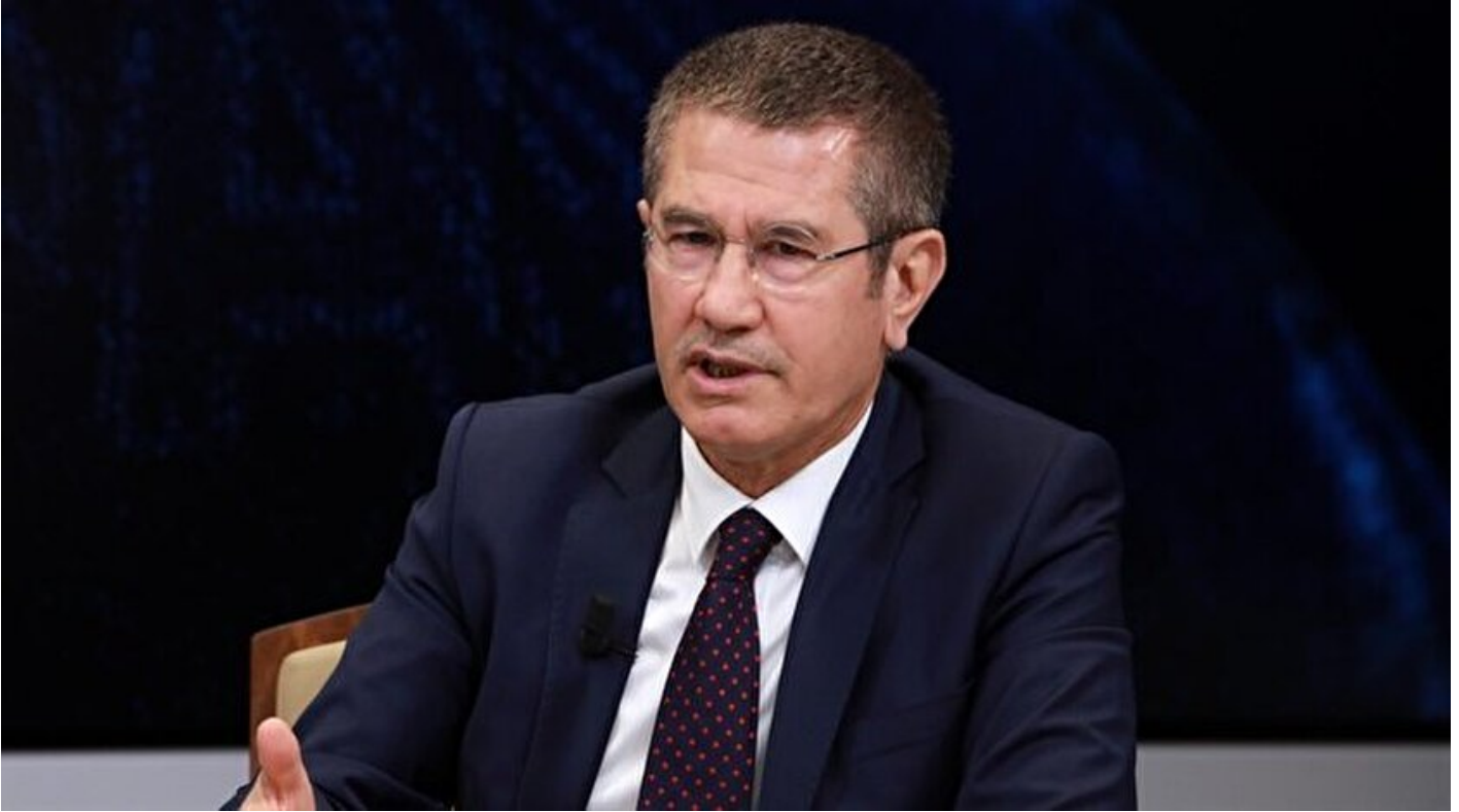
Milli Savunma Bakanı Nurettin Canikli