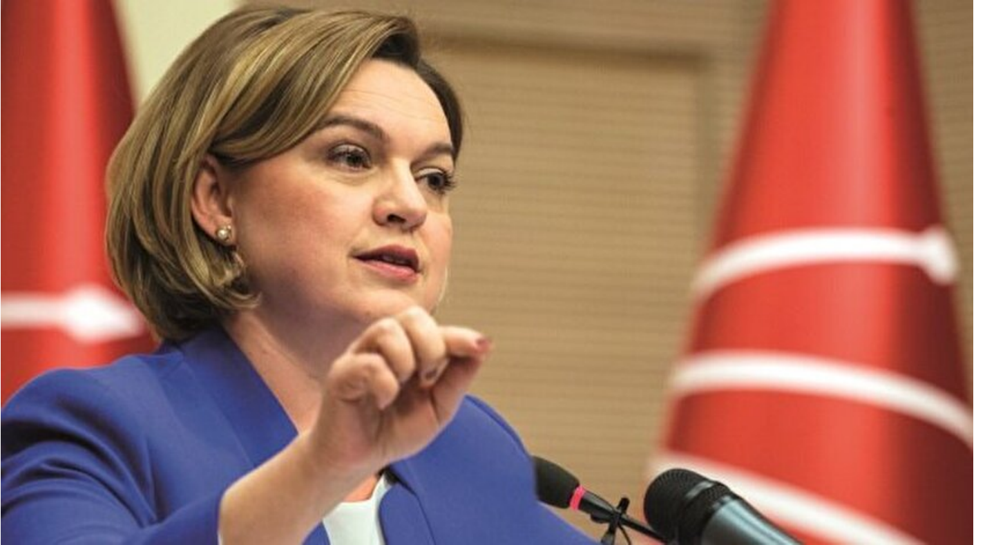
Selin Sayek Böke

Haber Merkezi · 08 Mayıs 2017, 04:00 · Son Güncelleme: 08 Mayıs 2017, 11:38 · Yeni Şafak