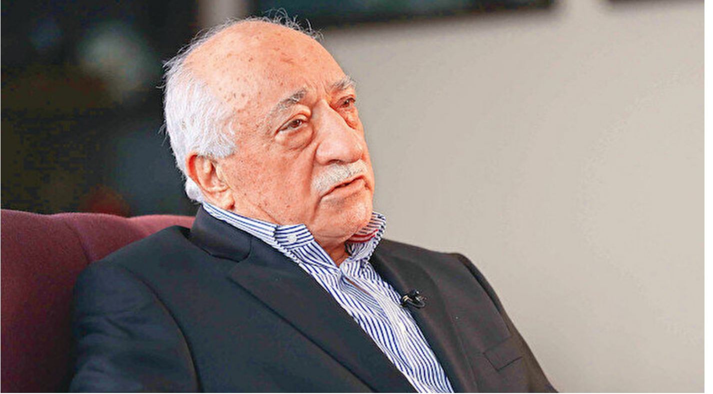
FETÖ elebaşı Gülen

Haber Merkezi · 09 Ekim 2020, 10:24 · Son Güncelleme: 09 Ekim 2020, 11:08 · AA